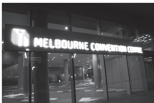
写真 1 ICCS&T が開催された国際会議場です。とても綺麗で新しい建物でした。会議室がたくさんあり、発表するための設備が整っていました

ICCS&T での口頭発表が決まったときは、貴重な機会を頂いたことにごく喜んだのですが、一方で日に日に不安が募ったのも事実です。今回が全く初めての海外での発表でしたので、先生や研究室の学生に何度も発表内容を見てもらい、図面・原稿の修正を重ね、質問対策をして臨みました。秋田から東京とシドニーを経由してメルボルンに向かいました。東京からシドニーまで、およそ 10 時間のフライトでしたが、このように長時間飛行機に乗ることは初めてでした。飛行機に乗っている間は、時折音楽を聞いたりしながらも、発表のことを思い出してはストップウォッチ片手に話す速さを調整しながら発表練習を繰り返していました。通路側の席で多少広く感じたのですが、窓からの景色が見られなかったのが少し残念です。メルボルンに着いてからは、ホテルに移動し、国際会議場付近を散策しました。会場は 2009 年に建てられたもので、外観が近代的でした。また、会議室がたくさんあり、