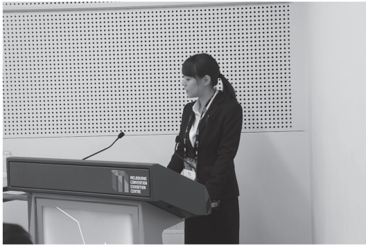
写真3 発表している様子です。時々ストップウォッチで時間を確認しながら発表していました