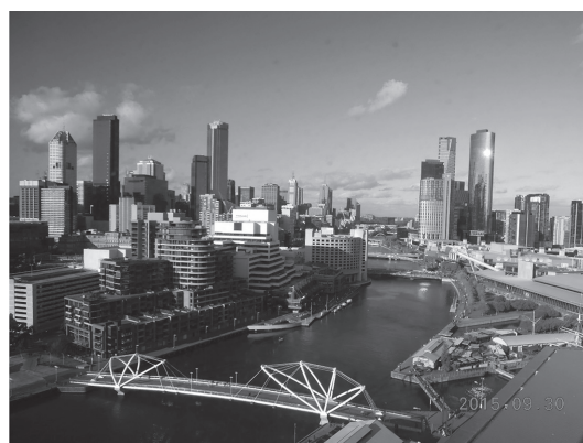
写真 2 ホテルからの眺めです。右下に写っている屋根が国際会議場です