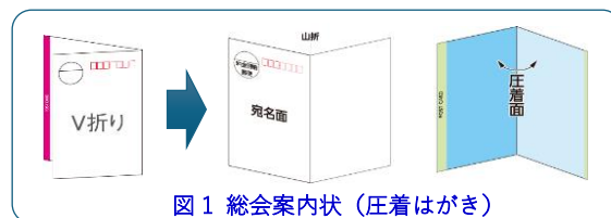
図 1 総会案内状（圧着はがき）

はがきの内面（圧着面・下図）に総会議事次第、総会出欠回答フォームの利用方法、ならびに総会資料へのアクセス方法を記載しています。