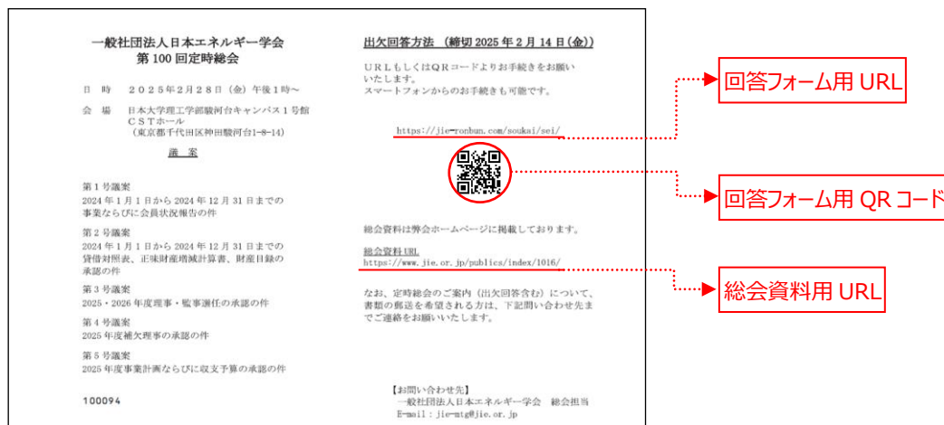
図 2 総会案内状（圧着面：総会議案、出欠回答方法）

出欠回答フォームは正会員用と維持会員用があります。それぞれ総会案内状に記載の QR コードまたは URL によりアクセスしてください。PC またはスマホからでもアクセス可能です。