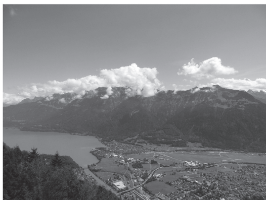
写真4 ハーダー・クームからのインターラーケン

答では、プレnstedd酸点の発現メカニズムや将来的な応用など研究内容について深い議論ができました。さらに、アンモニアボランは熱分解によっても脱水素できることから、熱分解反応および加水分解反応でどちらが有効的な脱水素方法なのかといった広い範囲での議論も展開