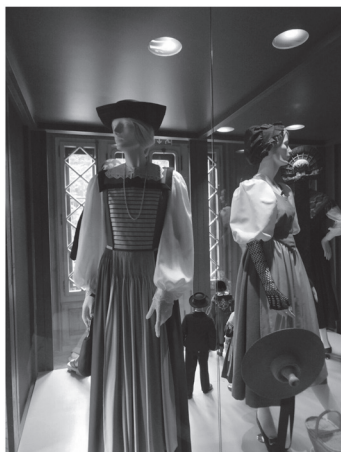
写真3 18世紀ごろのスイスの女性衣装