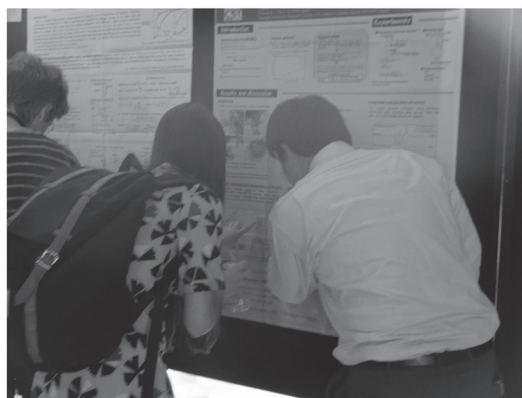
写真2 ディスカッション風景